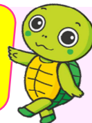
タートルクラブ マスコット